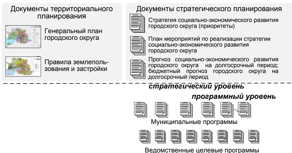
Рисунок 8. Система документов стратегического планирования

Структура целей и задач, зафиксированных в Стратегии должна отражаться в целях и задачах формируемых структурными подразделениями администрации муниципальных и ведомственных целевых программ.