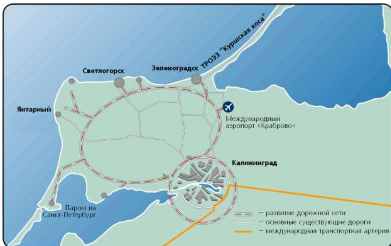
Рисунок 6. Транспортная система Калининградской области

Одним из важнейших вопросов в среднесрочной перспективе является развитие центральной части города (помечена красным прямоугольником на рис. 7), возрождение ее историко-культурного значения. С учетом значимости данной территории с точки